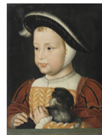
Henri II, roi de France (1519-1559), d'après Jean Clouet