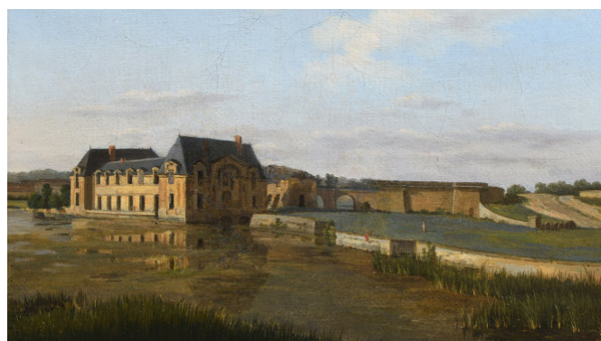
Vue du Petit Château de Chantilly entre 1799 et 1814