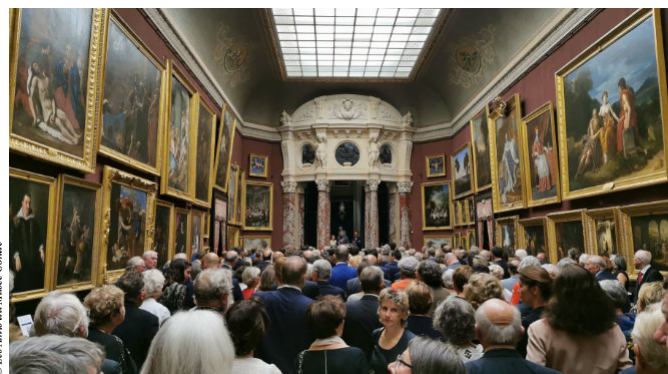
Grosse affluence pour la soirée de gala

• Il est prévu une réunion d'accueil des nouveaux adhérents 2021, le samedi 22 janvier 2022. Une invitation leur sera adressée début janvier 2022.