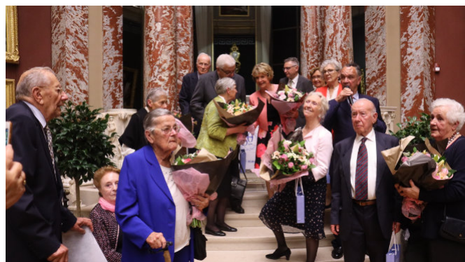
Mise à l'honneur de nos adhérents de 1971 et de 1972