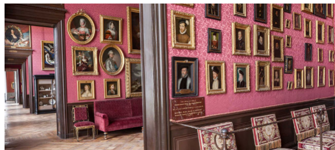
Salle des Clouet